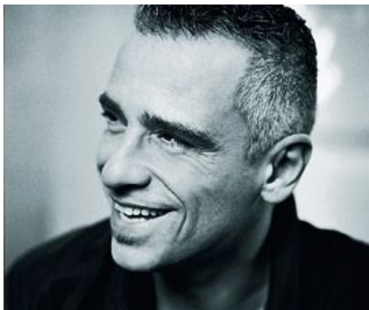
Frisch geschieden und voller Tatendrang: Eros Ramazzotti, 46, hat soeben sein neues Album «Ali e radici» veröffentlicht

(Lacht) Nun, das Kriegsbeil ist begraben. Ich kann Ihnen aber sagen, dass ich nicht mehr heiraten möchte. Vielleicht nochmals ein Kind, das wäre wunderschön, aber eine Ehe – nein. Ihr Album «Ali e radici» («Flügel und Wurzeln») deutet darauf hin, dass Ihr Leben zwischen Stillstand und Veränderung pendelt. Sind Sie zurzeit in einer Wurzel- oder Flügelphase? Lustig, meine Freunde fragen mich das auch fast täglich, um mich hochzunehmen: Hey Eros, bist du heute Wurzel oder Flügel? Ich bin der Flügel-Typ. Ich muss immer wieder weiterziehen, wie damals, als ich Rom verliess und nach Mailand kam. Sie sind ja in Cinecittà bei Rom aufgewachsen, was nicht ohne Folgen blieb: Sie haben in Fellinis Meisterwerk «Amarcord» als Statist mitgespielt.